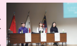
日本発/世界発: 青年のメッセージ▶

高校生による国際教育弁論大会にあわせて、当協会が留学生によるシンポジウムを開催し、日本の若い世代へのメッセージを発信します。