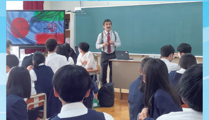
外国人講師による国際理解 (ワールドキャラバン事業)