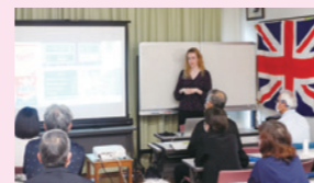
▲世界文化セミナー

県民の皆様を対象に、外国人を講師に迎え、各国の文化や社会事情について英語で話し合う講座を開催します。