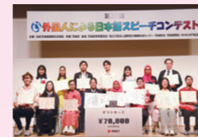
▲外国人による日本語スピーチコンテスト

在住外国人の日本社会への意見や印象を聞くことで県民との相互理解を図るとともに、外国人に日本語による意見発表の機会を提供することで日本語学習意欲を醸成します。