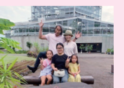
▲ふるさとファミリー事業

留学生や外国人住民に、ホームステイをきっかけとしてホームステイホストファミリーと継続的に交流する、「茨城の家族」を作る場を提供します。