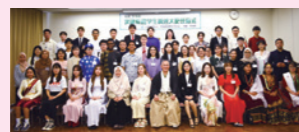
▲留学生親善大使任命式

県内の外国人留学生を親善大使に任命し、国際理解や国際交流を推進するイベントや講座で活躍していただきます。