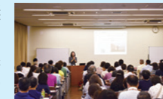
▲ネットワーク会議

市町村及び市町村国際交流推進組織、民間国際交流・協力団体を対象に活動の情報交換及び研修を実施します。