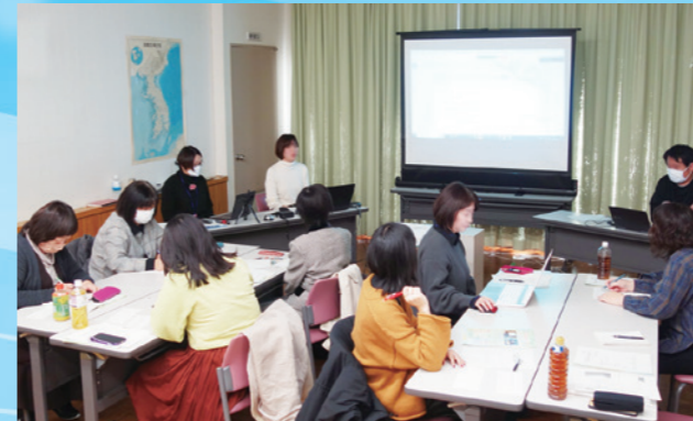
日本語教師対象の人材養成研修 (地域日本語教育の体制づくり事業)

日本人と外国人が、共に地域社会の一員として安心・安全に暮らせる、多文化共生の環境整備が急がれており、茨城県は今年度、外国人材の確保・育成の促進と生活支援策を一層推進する施策を展開します。当協会は県施策と連携し事業を推進してまいります。重点事業として、地域日本語教育の体制づくり、外国人相談体制について、新たな取り組みを行います。また、国際理解教育等の推進を通して県民の異文化理解等を図ります。国際交流団体に加え多様な主体と連携しながら、異なる言葉・文化的背景を持つ人々が調和した地域社会づくりを目指します。